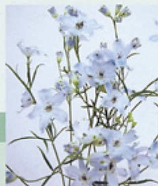
学名 デルフィニウム・シネンシス キンポウゲ科デルフィニウム属 ●和名 飛燕草 ●花言葉「清明」

一重の花をスプレー状に咲かせるのが特徴です。 淡いブルーの小花をライン状に咲かせます。 デルフィニウムという名前は花の形がイルカ（ギリシア語で「デルヒ」）に似ている事に由来しているという説があります。 青には気持ちを落ち着かせる効果があります。頭痛がするときや気持ちが洗んでいる時にこのデルフィニウムを見ると気持ちが穏やかになりそうな気がします。 夏など水を入れたガラスの器に花だけを浮かべると、きっと涼しげで綺麗でしょうね。