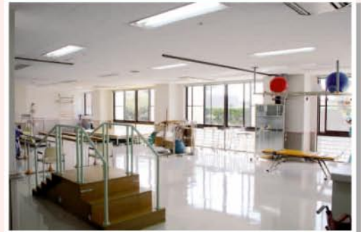
リハビリセンター