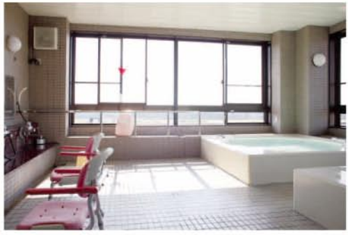
当院自慢の展望大浴場