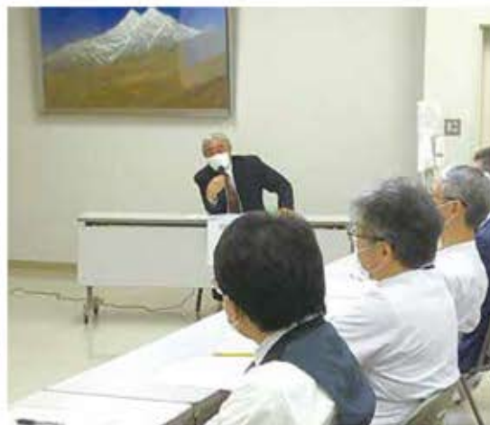
令和5年度 院内研究発表会を行いました。 コロナ禍で休止していたため、4年ぶりの開催となりました。